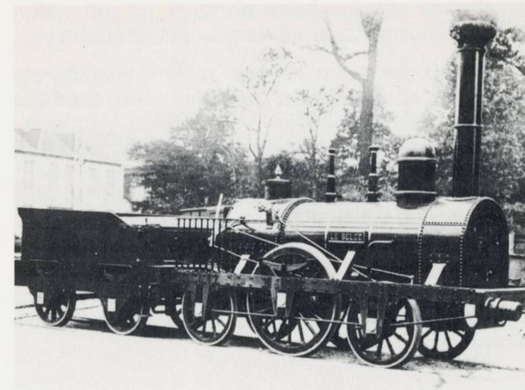
« Le Belge » - Eerste locomotief voor reizigerstreinen in België gebouwd - 1835.

Er ontstonden dan een aantal kleine maatschappijen die vergunning bekwamen om een reeks lijnen uit te baten die ze autonoom exploiteerde tegen zeer uiteenlopende tarieven. Geleidelijk aan hebben ze zich verenigd en in 1866 werd besloten een eenvormig tarief toe te passen.